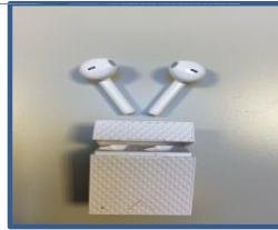
Foto del prodotto Picture of the item

L'oggetto descritto è conforme alla pertinente normativa di armonizzazione dell'Unione: